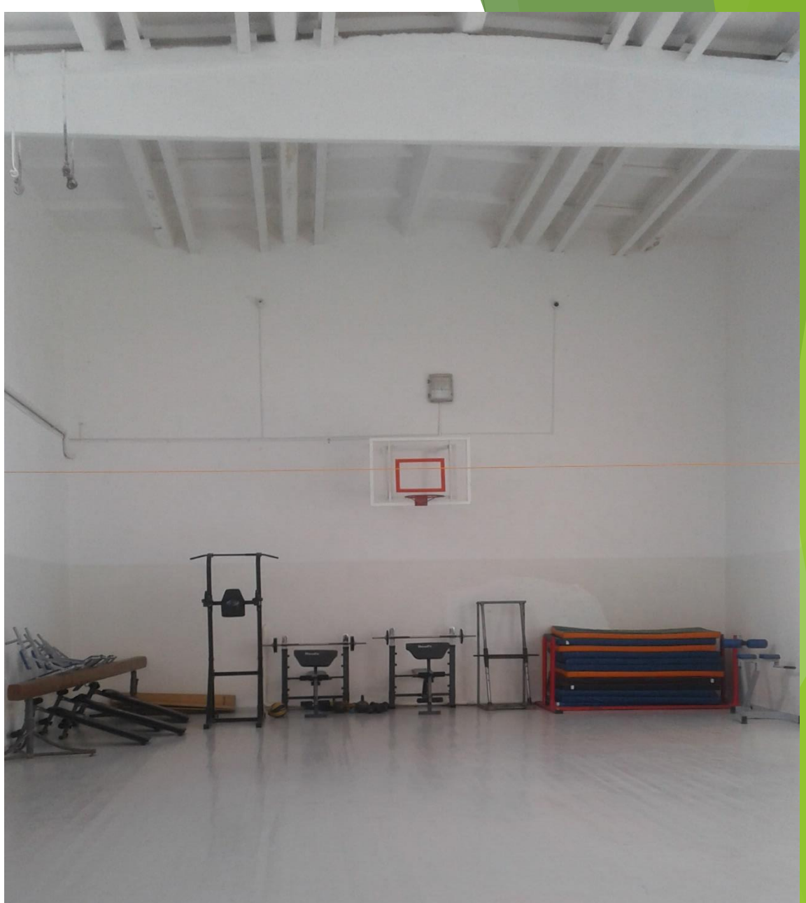
Гимнастический спортивный зал