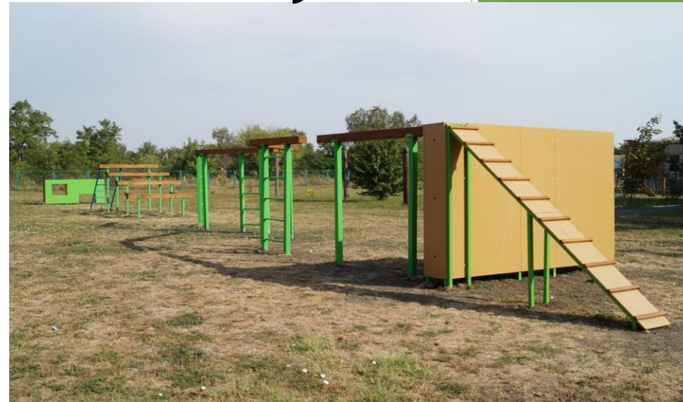
Военная полоса препятствий