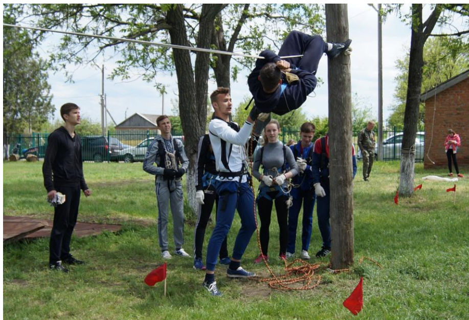
Туристическая полоса препятствий