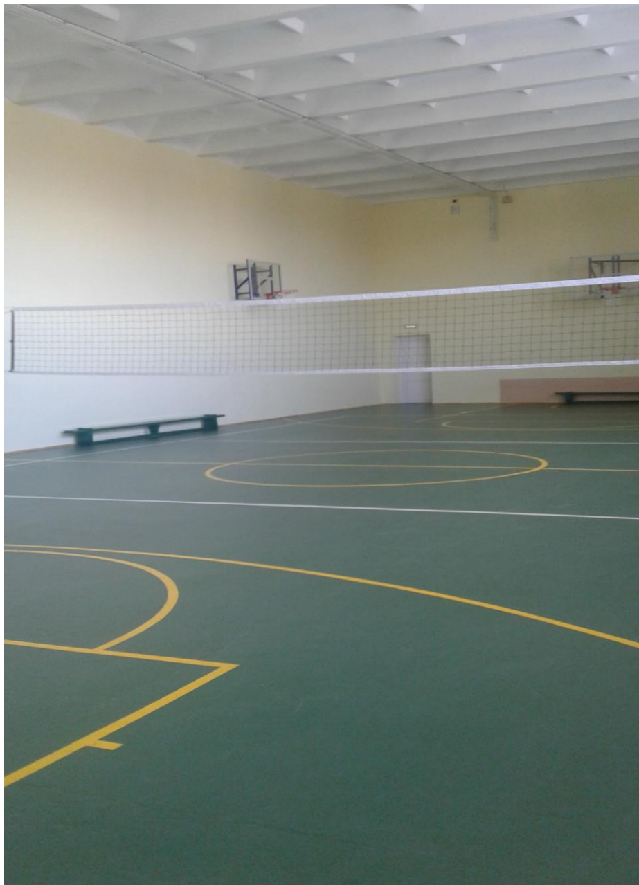
Игровой спортивный зал