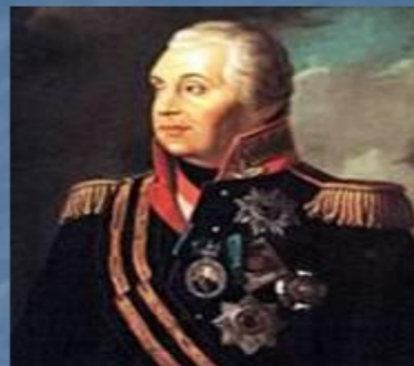
М. И. Кутузов

М. И. Кутузов, М. Б. Барклай-де-Толли, И. Ф. Паскевич, И. И. Дибич-Забалканский. А. В. Суворов