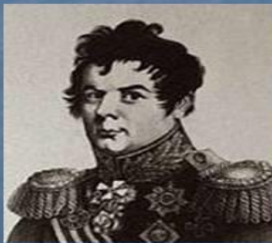
И. И. Дибич-Забалканский