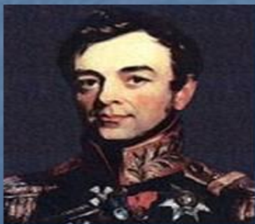
И. Ф. Паскевич