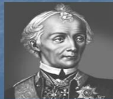
А. В. Суворов